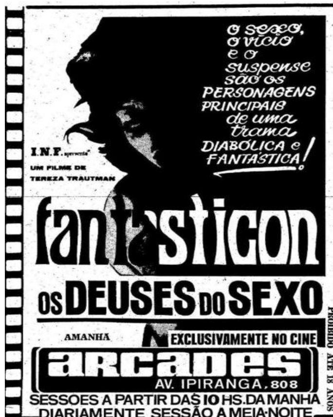
Figura 1: Cartaz do filme Fantasticon. Os deuses do sexo (1971) com destaque para a autoria de Tereza Trautman.

“Mas porque não há outras mulheres?”. E percebi que eu, de fato, não sabia responder. Não havia refletido sobre isso. Depois disso, me separei.... Acabei me apaixonando pelo Alberto Salvá 5 , trouxe meu filho de São Paulo, montamos casa juntos. Em outubro daquele mesmo ano eu comecei a escrever o roteiro de Os homens que eu tive (1973). Escrevi o roteiro em 15 ou 20 dias, foi no mês de outubro – lembro bem que chovia bastante. Estávamos sentados à mesa de centro: eu de um lado, Alberto do outro, cada um com sua máquina de escrever, escrevendo seus respectivos roteiros.