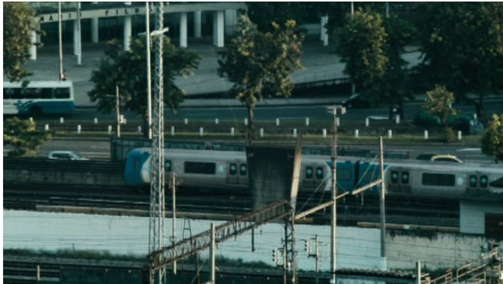
Figura 2 – Movimento na estação ferroviária em O samba que mora em mim (2012).

Não sem motivo, um dos principais eventos comemorativos do Dia Nacional do Samba tem a estação ferroviária como cenário. Idealizado por Marquinhos de Oswaldo Cruz no ano de 1996, o Trem do Samba toma como desculpa para acontecer o dia 2 de dezembro, data em que Ary Barroso, famoso pela composição Na baixa do sapateiro , visitou Salvador, capital que testemunhou as origens do samba, pela primeira vez. Nas últimas duas décadas, o Trem do Samba vem funcionando como uma homenagem a Oswaldo Cruz, bem como a outros subúrbios tomados pelo samba, levando passageiros da Central do Brasil, estação no centro do Rio de Janeiro, à periferia. Ironicamente, a ação, que visa dar destaque a esses sambistas, acaba servindo à reiteração da distância que há em relação ao restante da sociedade. (TREM DO SAMBA, 2014). Entre tantos sambas, Trem das onze , do paulista Adoniran Barbosa, talvez seja o que melhor explicita o espaço ocupado pelo transporte nas composições. Lançada em 1964, imortalizada por Demônios da Garoa , a composição coloca o trem no centro da narrativa. O argumento de que o eu lírico não pode perdê-lo para voltar para casa, inclusive, desdobra-se em situações semelhantes em letra e melodia de outros compositores.