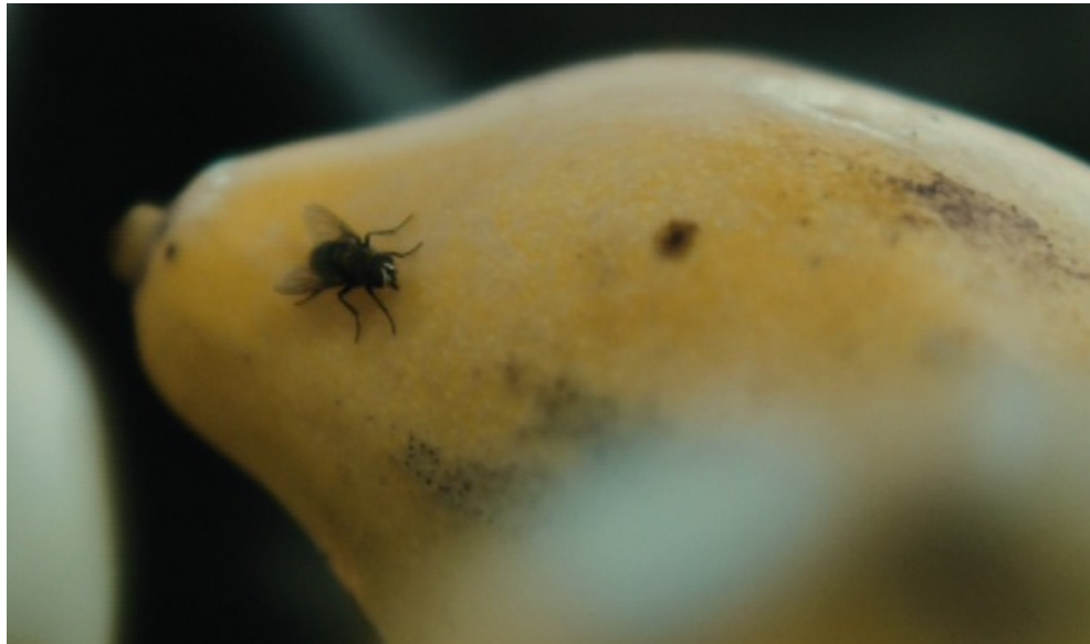
Figura 4 – Fly-on-the-wall documentary ou câmera que se pretende invisível.