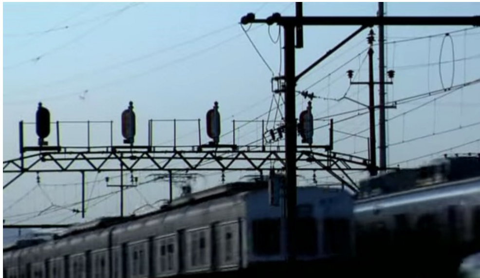
Figura 1 – Trens chegando e partindo em O mistério do samba (2008).

lembram, das histórias por trás de uma História oficial. Imagens de Oswaldo Cruz cobrem esse áudio. São detalhes que sugerem um subúrbio fotogênico: um vaso de flores, uma fachada de bar, um fusca azul na garagem. É a chegada não só do espectador, mas também do realizador, àquele endereço. Nesse sentido, um plano é significativo – e fará parte também da narrativa de O samba que mora em mim . A estação de trem, a plataforma do trem, os trilhos do trem, o trem chegando, o trem partindo. É fato que o transporte ferroviário é parte daquele cenário, de Oswaldo Cruz e de outros subúrbios, mas é sintomático que funcione como metáfora. Visualmente, é um plano que afirma uma chegada. Mais ainda, afirma um trajeto empreendido até aquele lugar. Espectadores são transportados para onde moram os sambistas em questão. E vindos de cenários outros, distantes dali, realizadores posicionam-se como visitantes. Estão ali, mas não são dali. Criam, mas mediam.