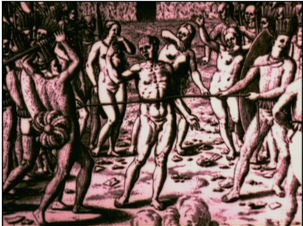
Fig. 1: Guerras de dispositivos incluem ilustrações do livro de Hans Staden...

Obra maior, mas pouco estudada, do movimento tropicalista do final dos anos 1960, Como era gostoso o meu francês (Nelson Pereira dos Santos, 1970-72) recicla os ideais antropofágicos do modernismo brasileiro dos anos 1920, cuja base se encontra na literatura europeia colonial. O enredo aparentemente linear do filme versa sobre um francês devorado por índios tupis no século XVI, ao estilo do relato autobiográfico do aventureiro Hans Staden, que teria escapado por pouco de destino semelhante em viagem ao Brasil. Mas a tessitura do filme é na verdade uma colagem de materiais diversos no melhor estilo tropicalista, entre eles: citações textuais, em forma de intertítulos, de testemunhos do explorador protestante Jean de Léry (figura 1), do abade católico franciscano André Thevet, do calvinista Nicolas de Villegaigon, dos missionários jesuítas José de Anchieta e Manoel da Nóbrega e das autoridades governamentais portuguesas, com seus diversos graus de benevolência ou desconfiança para com os costumes