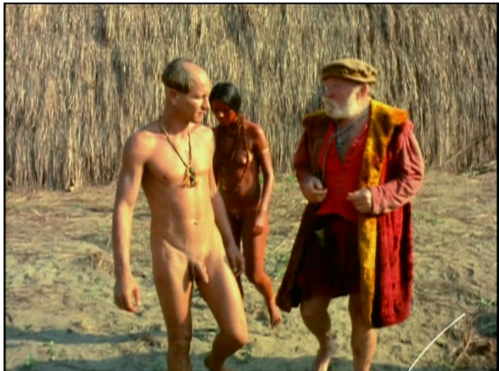
Fig.3: Culturas intercambiáveis em clima de liberdade.

A 'tribo' a que se refere Salem é formada pelo elenco e a equipe dos três filmes que o diretor ali produziu, Azyllo muito louco (1970), Como era gostoso o meu francês e Quem é Beta? (1972). Vivendo nesse retiro comunitário em estilo hippie, a tribo de Nelson continuava assim, a seu modo, a usufruir da liberdade ceifada pela virada política conservadora. Em Como era gostoso o meu francês , quase se pode palpar esse modo livre de viver. A liberdade sexual reivindicada pela antropofagia modernista a partir do símbolo fálico do pau-brasil encontra-se aqui anunciada desde o título do filme, que qualifica o francês de 'gostoso', num trocadilho entre o gosto de sua carne, saboreada no final por sua amante índia Sepoipepe, e seus atributos sexuais, que a câmera se deleita em evidenciar (figura 3).